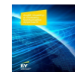
Audit Quality: A Globally Sustainable Approach