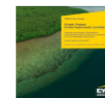
Good Group (International) Limited