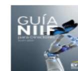
Guía NIIF para Directores 2019/2020