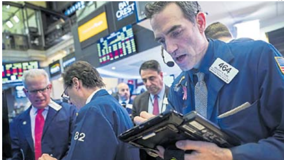
Mercados. Sus vaivenes provocaron un menor ingreso de inversionistas a fondos mutuos el año pasado.

En cambio, refirió que hubo un menor ritmo de ingresos de inversionistas por los vaivenes de los mercados, incluida la subida de tasas de